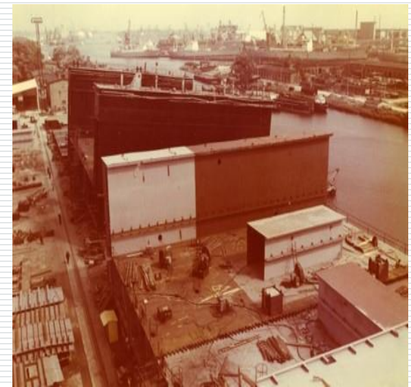
Ship Repair Yard „Gryfia” in Szczecin, Poland